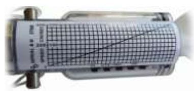
2030R 標準流速グラフラベル側