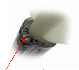
注水口 (水圧で破損しないよう水道水を注入します。)